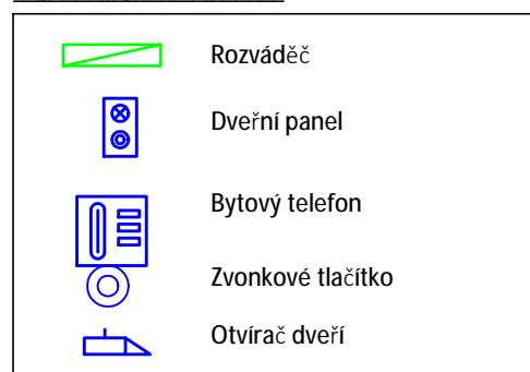
Legenda významu čar